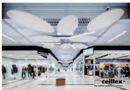
ショッピングモール